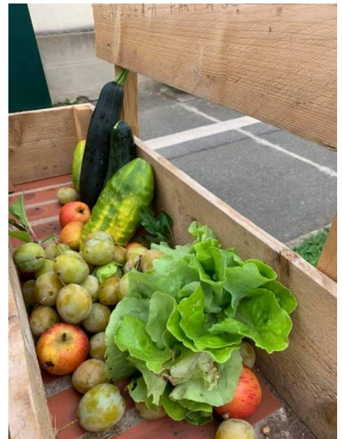
Boîte à partage